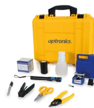
Kit de Ensamble para Conectores Mecánicos OPHE021FT