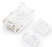
Plug RJ45 Cat 6A UTP OPCAJRJ45U6A