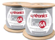
Bobina de cable U/UTP CMR Cat 6A gris OPCABOCAT6AZUTPGR