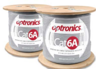
Bobina de cable U/UTP CMR Cat 6A azul OPCABOCAT6ASUTPAZ