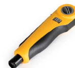
Herramienta de impacto ajustable profesional OPHE3640R