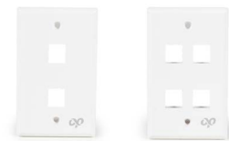
Placa de pared de 4 puertos OPCAPLS4