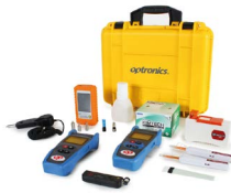
Kit de medición y limpieza planta interna OPHEKMELINT