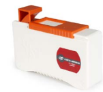
Casete limpiador de férula OPHECCASETEG