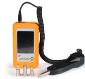
Microscopio de inspección OPEMFVM100