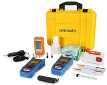
Kit de medición y limpieza planta interna OPHEKMELINT