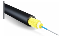
Cable Int-Ext Figura 0 de fibra óptica OPCFOIE39DR001TP