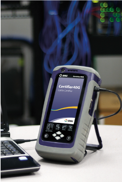
Completo software de generación de informes de escritorio para PC