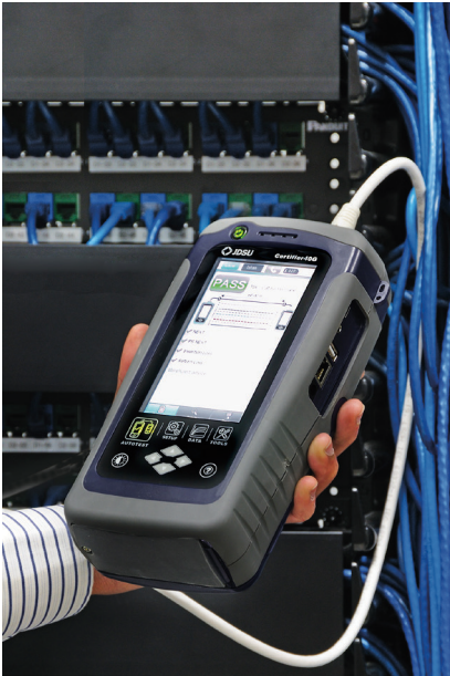
Increíble facilidad de uso con pantalla táctil gráfica de gran tamaño