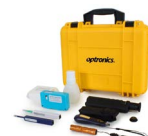
Kit Optronics Fiber Clean-OP OPEFCOP