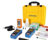
Kit de medición y limpieza OPEKMEINT