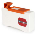
Casete limpiador de férulas OPECCASETEG