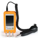
Microscopio de inspección OPEMFVM100