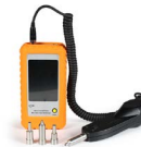
Microscopio de inspección OPEMFVM100