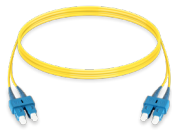
Jumper SCU-SCU Monomodo Dx OPJUSCUSCU09D0010R13