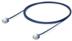
Patchcord UTP OPCAPCC6A01PAZ