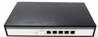
*Imagen de producto solo representativa