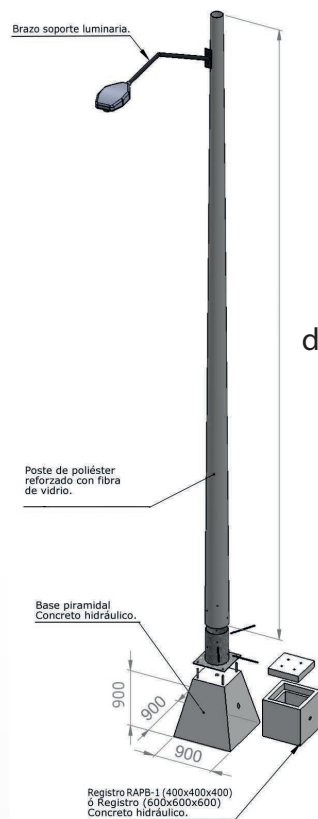
Montaje sobre base piramidal e inserto metálico