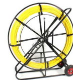
Guía de fibra de vidrio OPHEGFV9X305