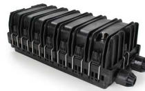
Cierres de empalme OPCEH14468FB