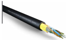
Cable de fibra óptica dieléctrico OPCFECE09D112PPSS