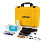
Fiber clean OP OPHEFCOP