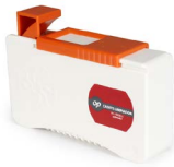
Casete limpiador OPHECCASETEG