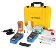
Kit de medición y limpieza OPHEKMELINT