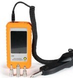
Microscopio de inspección OPEMFVM100