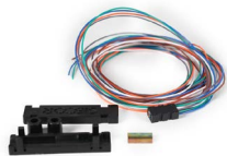
Fan Out Kit de 12 fibras OPMIFOK1236