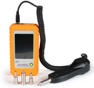
Microscopio de inspección OPEMFVM100