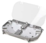
Charola de empalme OPCEHH024