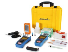
Kit de medición y limpieza OPHEKMELINT