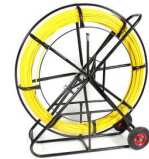
Guía de fibra de vidrio OPHEGFV9X305