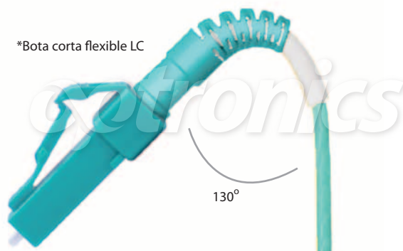
*Bota corta flexible LC